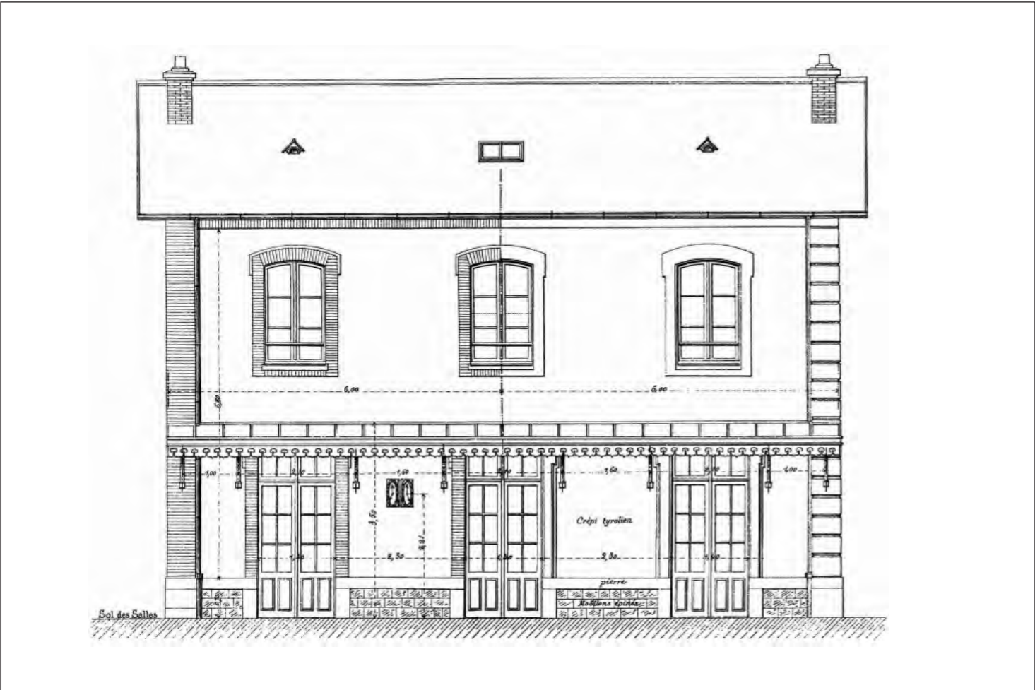
2. Façade côté voies