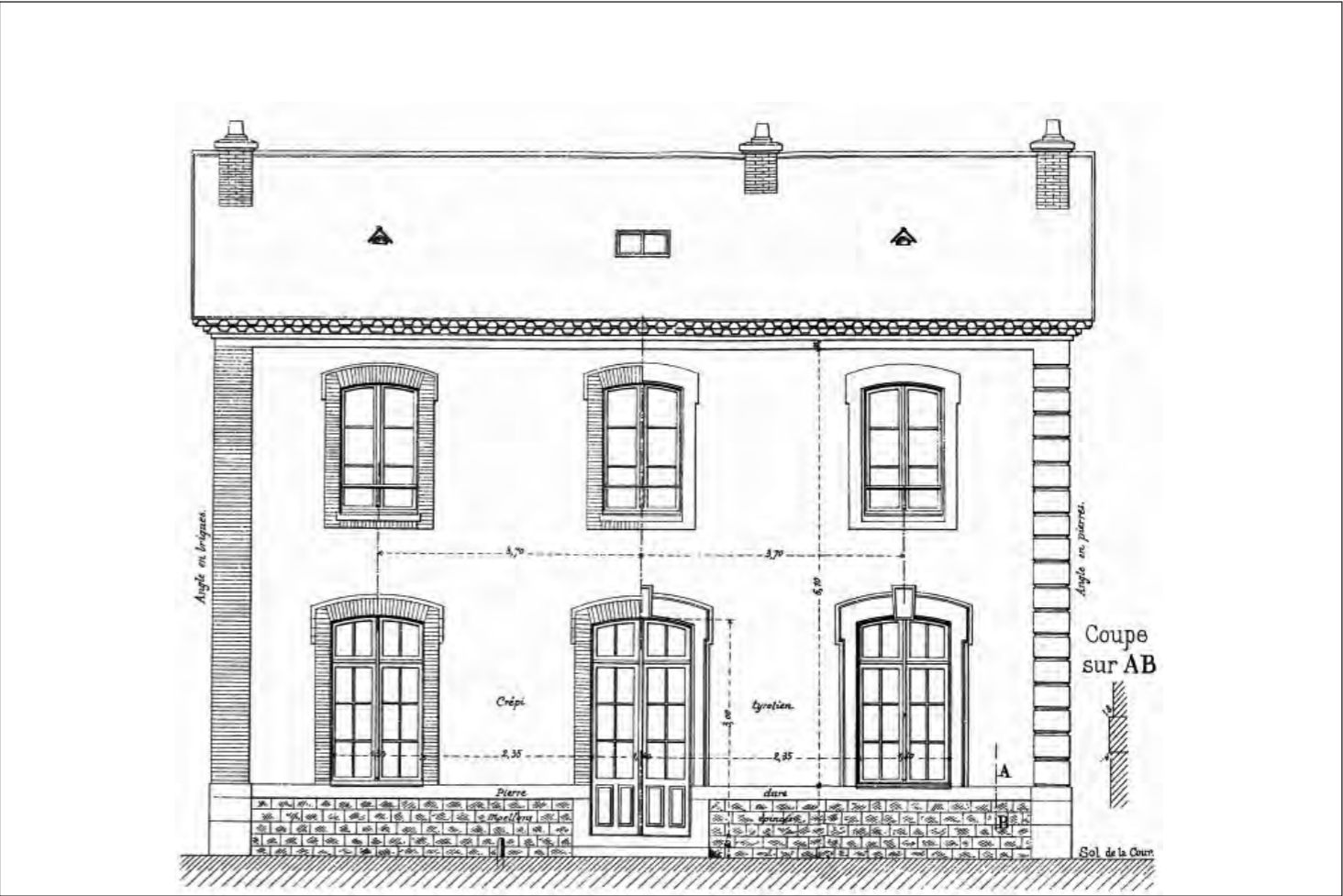
1. Façade côté cour